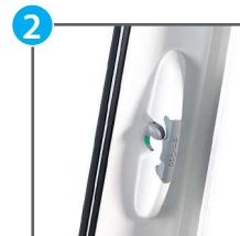
Poignée sur semi fixe (2 ème ouvrant)