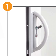
Poignée ouverte intérieure sur ouvrant principal